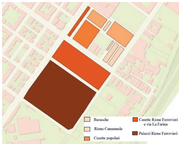
Figura 4. Mappa della percezione dello spazio urbano di Fon- do Saccà (2014-2017).

Mi giro subito e mi avvicino, spiegandogli che non siamo del Comune, ma dell'Università e che stiamo svolgendo una ricerca sulla zona. Da qui inizia un'interessante e tranquilla discussione, in cui, a dire il vero, è soprattutto il signore ad avere molta voglia di parlare e a tenere la parola sullo stato in cui versano gli abitanti della zona. Si lamenta soprattutto dell'assenza di tombini e di pendenza della strada, che non consente il convoglio e lo scolo dell'acqua piovana, determinando l'accumulo di acqua sul marciapiede e direttamente a ridosso della sua abitazione, così come delle altre. Mi fa notare che non ci sono tombini, io ne vedo uno, poco più lontano, e chiedo chi lo abbia fatto, lui mi risponde che è stato lui a farlo. In effetti, anche i tombini presenti in altri punti della zona, fra le baracche e le casette, hanno la stessa fisionomia e sembrano esser stati ricavati dagli abitanti. Anche lui sottolinea, come altri che abbiamo già intervistato nei mesi scorsi o coi quali abbiamo intrattenuto discussioni anche informali, che pulisce davanti casa e sistema continuamente la sua abitazione, in modo che sia sempre pitturata e immune dall'umidità, in quanto "è del mestiere" (Nota del 25/02/2016).