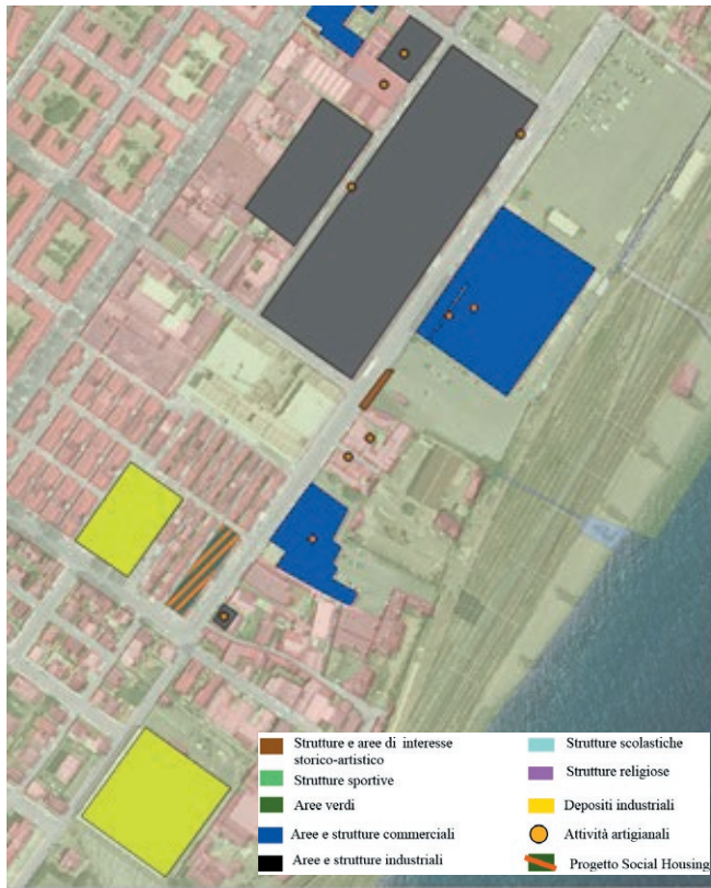
Figura 1. Area della ricerca TSR*.

un mondo dagli altri è indicato in una grossa via (la via La Farina ), che taglia in due l'area considerata: a monte, è collocato il quartiere operoso con le attività commerciali e il traffico costante dei veicoli; a valle, invece, verso il mare, si trova Maregrossa, con le sue caratteristiche e le sue regole specifiche valide solo al proprio interno.