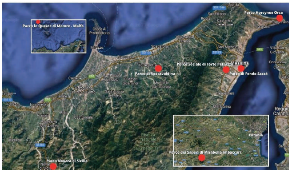
Figura 1. Mappa de I Parchi della bellezza e della scienza (IPBS) avviati sul territorio.

La Fondazione MeSSInA dal 2010 insieme ai suoi principali partner operativi (Ecos-Med, MECC, Solidarity and Energy, Fondazione con il Sud ecc.) sta sviluppando un importante programma di investimenti per I Parchi della Bellezza e della Scienza (IPBS). Si tratta di processi di riqualificazione territoriale, socioeducativa e tecnica scientifica, realizzati in luoghi strategici e di pregio storico e urbanistico, Parco Horeynus Orca, Parco Sociale di Forte Petrazza, Parco di Fondo Saccà, Parco di Roccavaldina, Parco di Malfa, Parco Novara di Sicilia, Parco dei Saperi di Mirabella Imbaccari (vedi Fig.1).