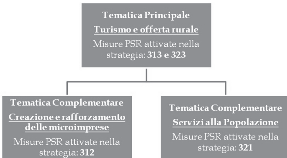
Fig. 1. Rappresentazione grafica della strategia di PSL proposta.

Gli obiettivi generali sono conformi al PSR Sicilia, incentrato sulla valorizzazione dell'itinerario rurale, inteso come un percorso fisico di fruizione delle risorse ambientali, paesaggistiche, tradizionali, culturali e alimentari che mirano a una