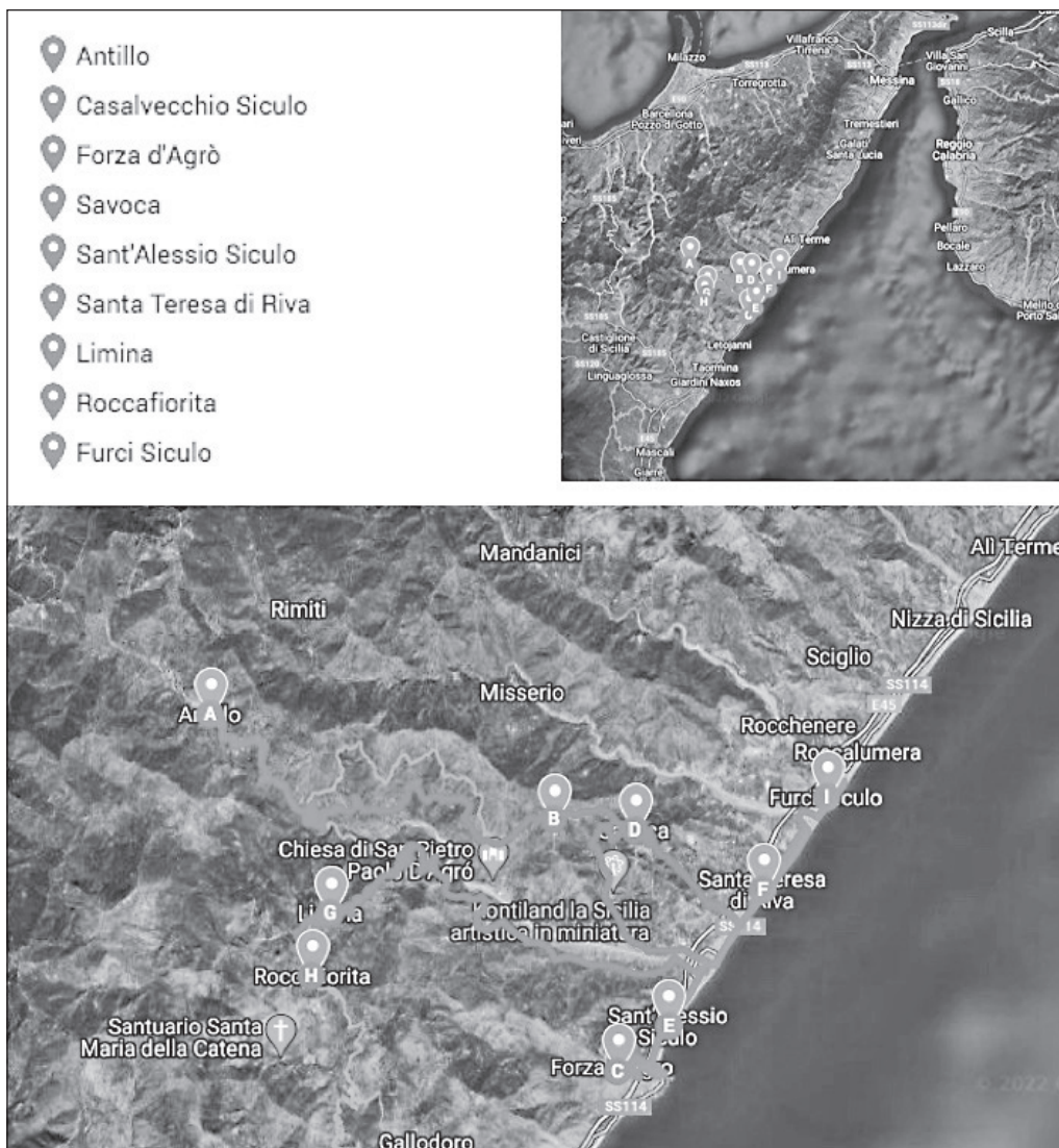
Fig. 2. I comuni della Valle d'Agrò.

pietrame a secco. I mulini, in particolare, ancora oggi rappresentano una testimonianza tangibile della presenza di una specializzazione produttiva ormai desueta. La Valle d'Agrò in passato era disseminata di opifici a ruota orizzontale, ritenuti tra i più antichi della Sicilia. Tale convinzione trova conferma in un mulino dalle caratteristiche proprie degli stabilimenti trecenteschi, rinvenuto nel 1930 lungo la fiumara di Agrò. Dei mulini rimangono ormai sparute tracce, fatta eccezione del Mulino Vecchio di Sant'Alessio Siculo, che è stato trasformato in una struttura per ricevimenti (Parco Ducale), mantenendo della sua fisionomia originaria la saja e la botte (Barilaro, 2015).