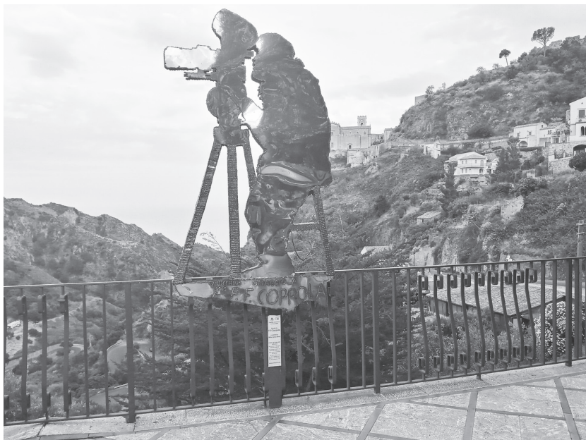
Fig. 3. Uno scorcio di Savoca.

quelle riprese furono la chiesa di San Nicolò, le vie del centro storico, il Palazzo Trimarchi e il Bar Vitelli. Oggi Savoca, che è annoverata e certificata tra i «Borghi più belli d'Italia» (solo dodici comuni in Sicilia), grazie a queste location e al successo globale delle pellicole di Francis Ford Coppola, è diventata una tappa obbligatoria per visitatori e (cine)turisti che si recano nella Valle d'Agrò per ammirare un patrimonio culturale riconoscibile nella memoria, nelle tradizioni, nella storia delle comunità, negli irripetibili paesaggi. La domanda turistica, in continuo aumento, ha dato impulso alla nascita di diverse strutture ricettive, alcune già operanti, altre in fase di realizzazione, a conferma di un interesse imprenditoriale per il settore che ha ancora un ampio margine di crescita (Barilaro, 2009; Nicosia, 2012; Gambino, 2016).