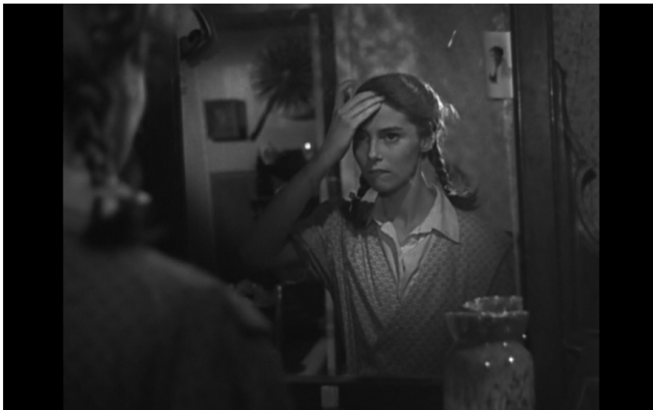
Fig. 4 - Il personaggio di Anna Maria Pierangeli allo specchio.