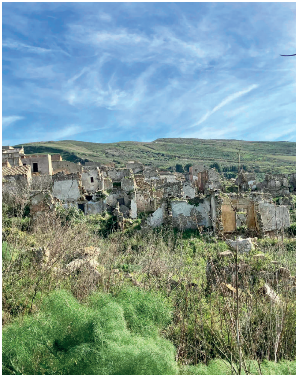
Fig. 7. Poggioreale vecchia, il fianco Ovest della città.