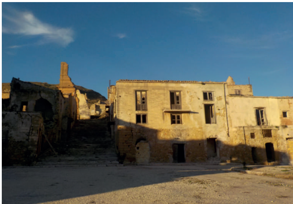
Fig. 6. La piazza i resti della Torre dell'Orologio nella ghost town di Poggioreale, set location de L'uomo delle Stelle (1995) e Malèna (2000) di Giuseppe Tornatore.