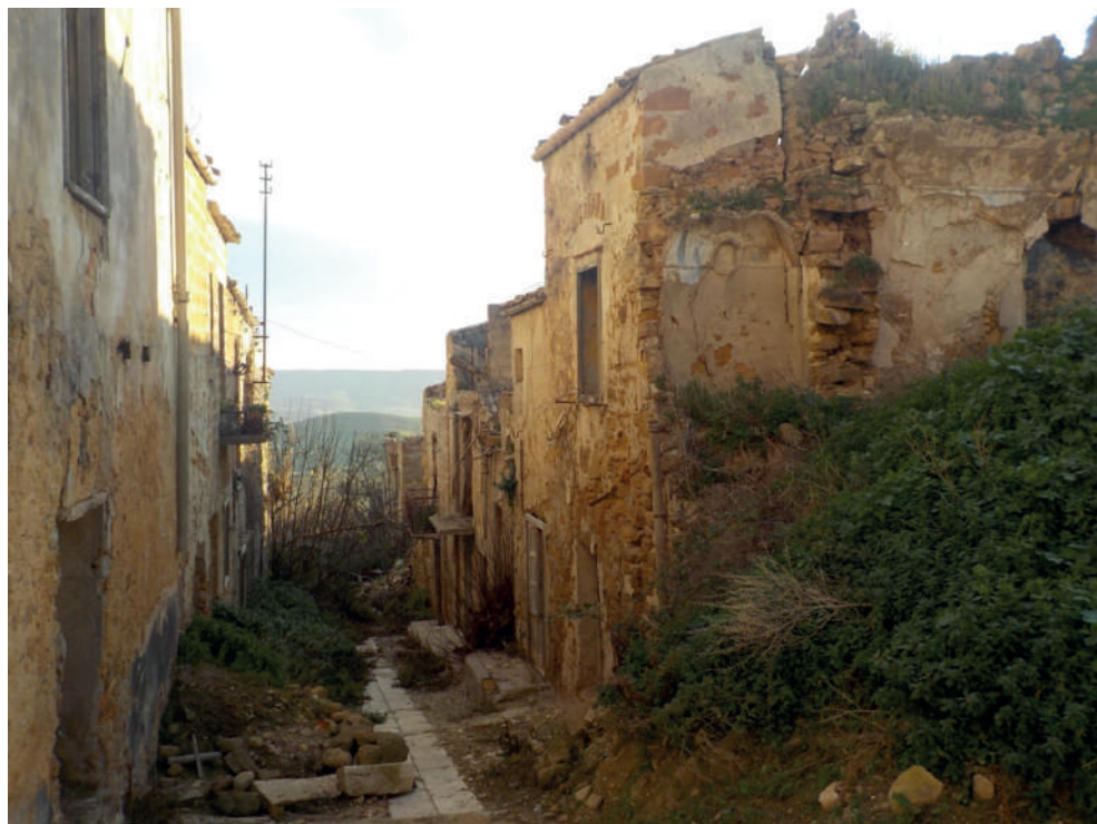
Fig. 8. Poggioreale vecchia. Dettaglio del frammento di paesaggio.