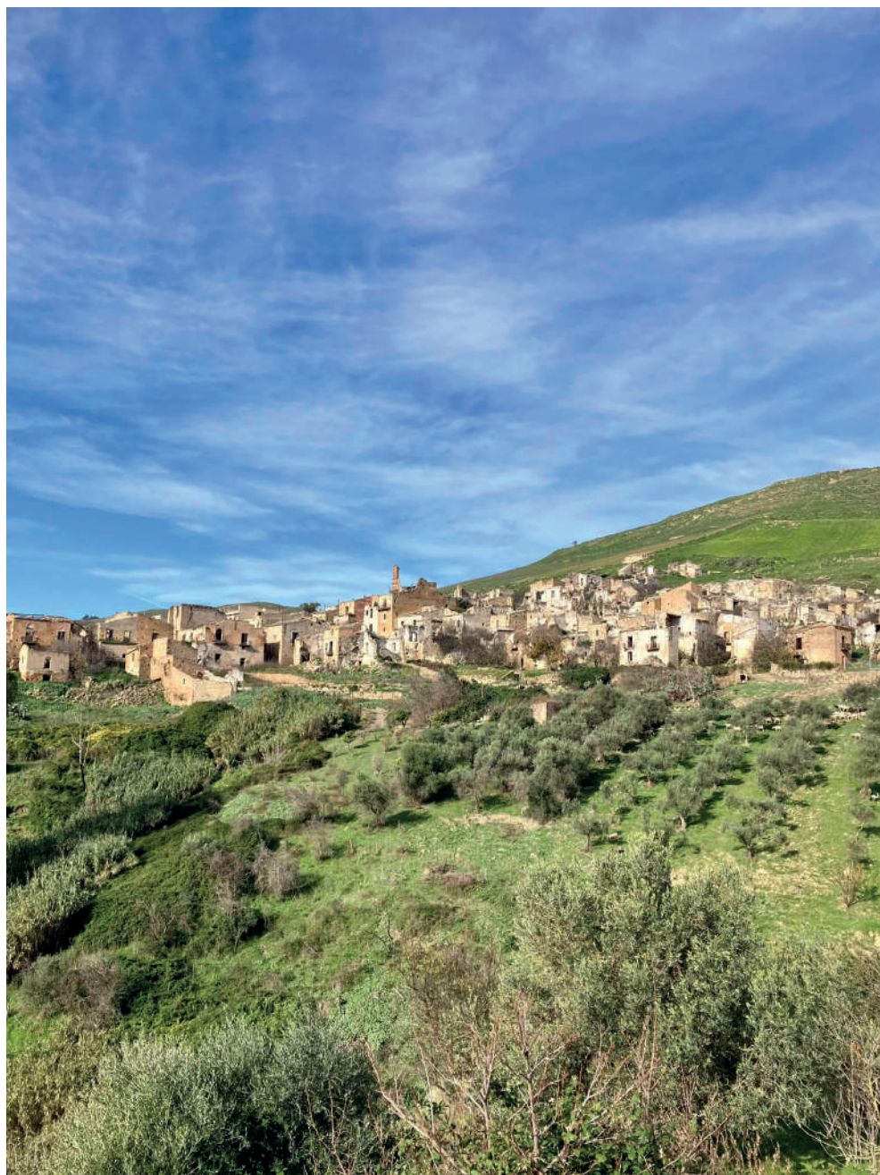
Fig. 10. Poggioreale vecchia. Veduta da Est.