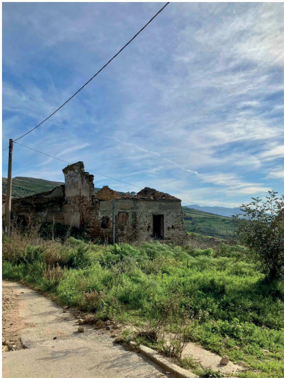
Fig. 5. Poggioreale vecchia, particolare.