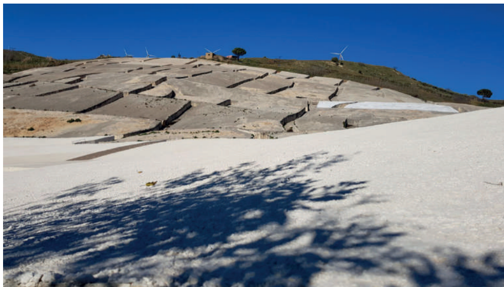
Fig. 1. Il Cretto di Burri a Gibellina Vecchia.