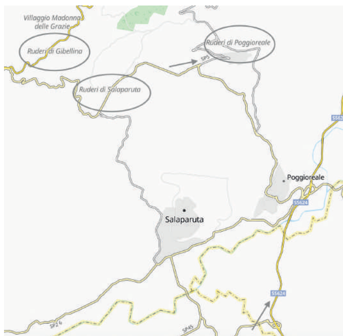
Fig. 2. La carta dei luoghi e delle infrastrutture stradali SP5 e SS624. Elaborazione di Giovanni Messina su carta stradale disponibile su https://www.viamichelin.it/