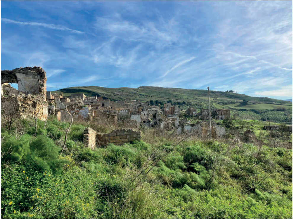
Fig. 9. Poggioreale vecchia, un particolare.