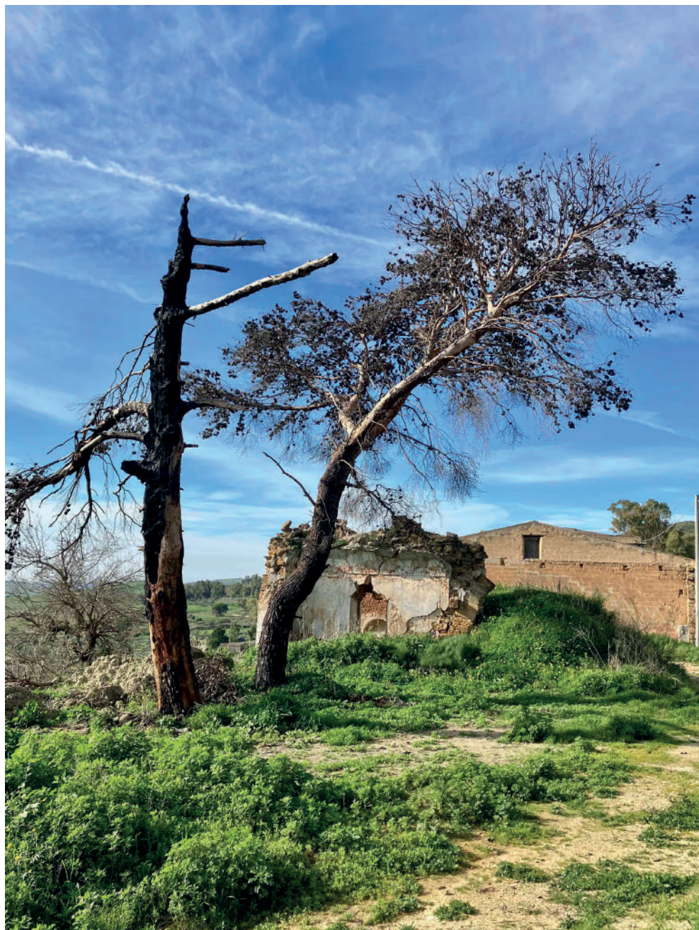
Fig. 4. Poggioreale vecchia, particolare.