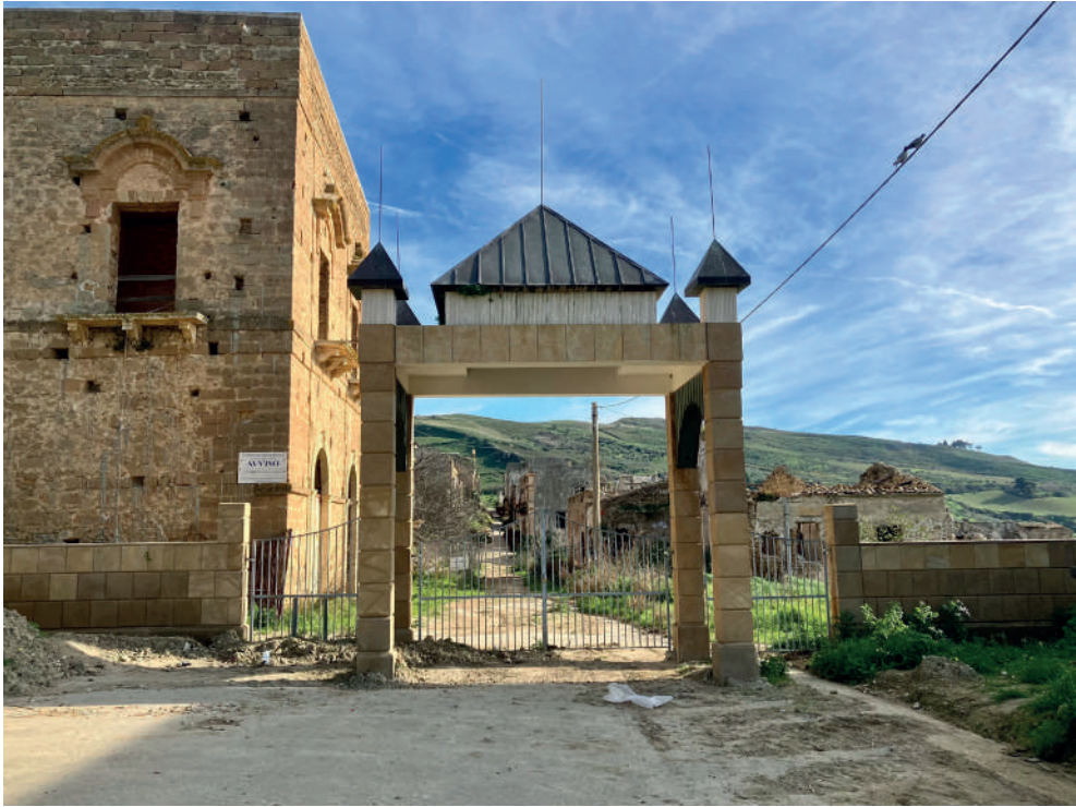
Fig. 3. Il cancello di ingresso a Poggioreale vecchia, al termine della SP5.